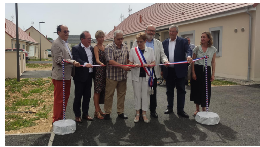
Inauguration de la résidence de Plaimpied-Givaudins - Juin 2022 - Val de Berry