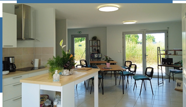
La maison commune, un espace de vie ouvert à tous - Val de Berry

PÔLE SENIORS VAL DE BERRY residenceseniors@valdeberry.fr Tél : 02 36 71 99 56