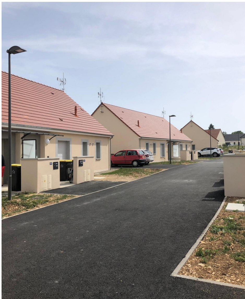
Résidence seniors services domotisée de Plaimpied-Givaudins - Conseil Départemental du Cher