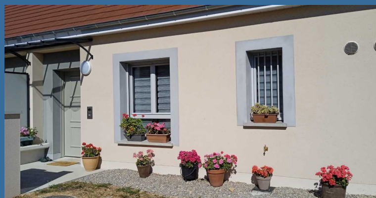
Les jardinières ont pris place à la résidence, un beau symbole de l'appropriation des lieux - Val de Berry

Maintenant, il me tarde de découvrir les prochaines animations proposées à la maison commune. Mon projet du moment est d'obtenir ma carte de bus pour redécouvrir ce joli petit coin entre ville et campagne ».