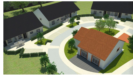
Vue 3D de la future résidence de Torteron - TCa&BP Architecture