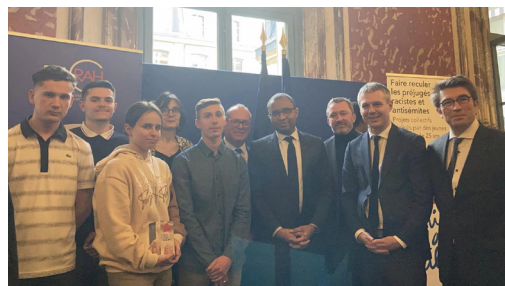
Jeunes reçus au Ministère de la Justice - Val de Berry