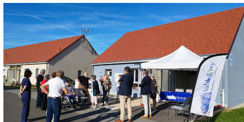
Photo - Signature charte - Val de Berry