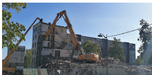
Photo - Démolition rue Paul Verlaine - Val de Berry

Je vous souhaite bonne lecture de cette nouvelle Newsletter ».