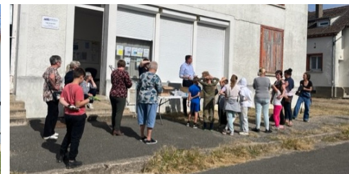
Photo - Quartier propre La-Guerche-sur-L'Aubois - Val de Berry